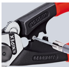
напрессовка концевой гильзы на тяговый трос