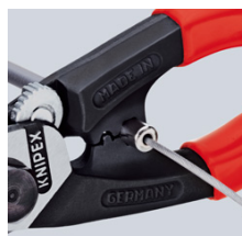
напрессовка наконечника на боуденовский трос